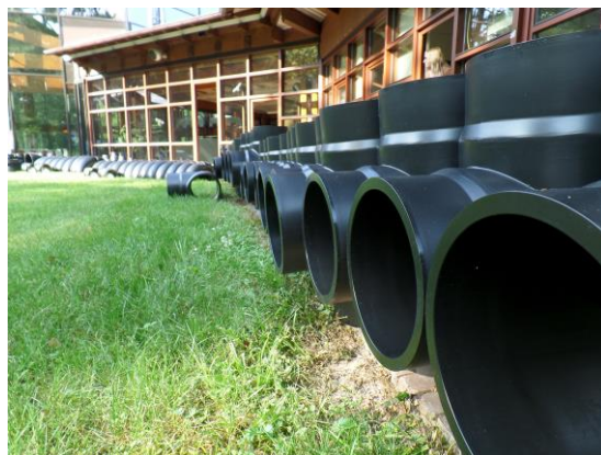
Symbolische Impression für die diesjährige Sanierung und Modernisierung

Weitere Informationen unter: www.keidelbad.de